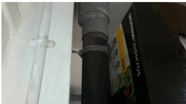
S1 - 2 (S1)